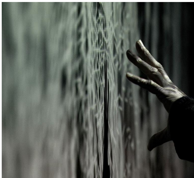
En Amour à la Philharmonie de Paris