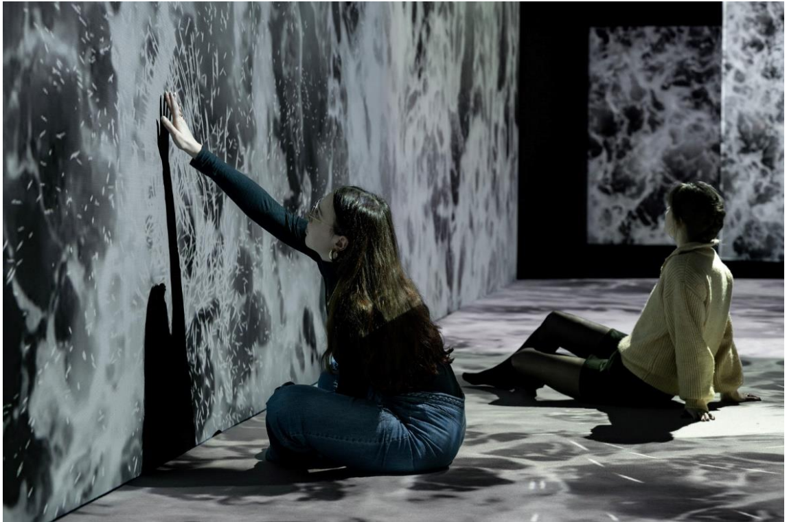
En Amour à la Philharmonie de Paris ©Joachim Bertrand