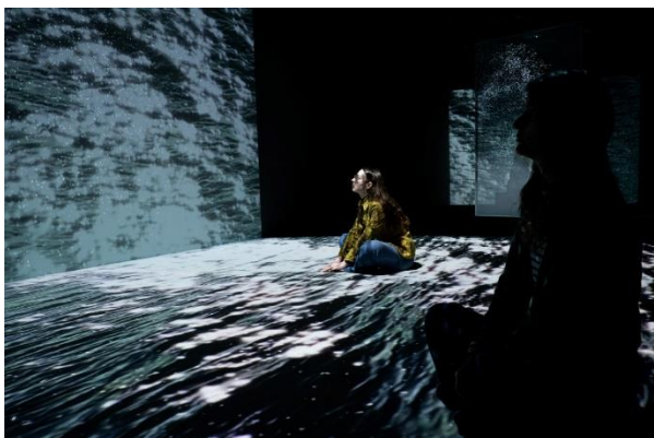
En Amour à la Philharmonie de Paris

Le public en mouvement est immergé dans l'image et la musique spatialisée, au coeur d'une grande pièce où une partie du sol et des murs est surface de projection. Plusieurs écrans prolongent l'image à la verticale. Déambulant, pieds nus, dans cet environnement sensible et réactif, le corps du public est une composante de l'oeuvre : les images sont modifiées par sa présence et son mouvement.